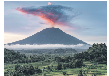
Вулкан Агунг на острові Балі (Індонезія)

Наприклад, сьогодні через людську діяльність – насамперед спалювання газу, нафти та вугілля, до атмосфери потрапляє в десятки разів більше вуглекислого газу, ніж вивергають усі вулкани на планеті.