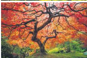
ПАРК НІТАСНІ, ЯПОНІЯ