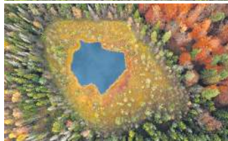
ЦЕНТРАЛЬНИЙ ПАРК, НЬЮ-ЙОРК