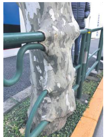
Це дерево виросло навколо перил