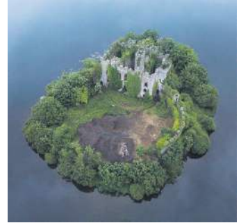
Закинута фортеця в Ірландії