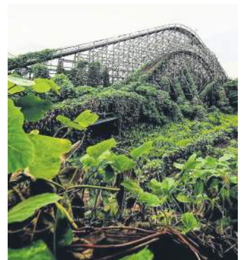
Закинута американська гірка