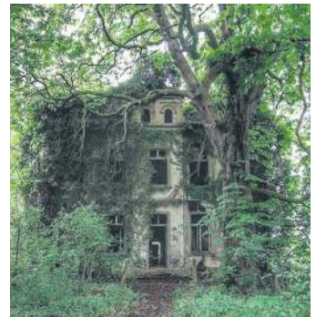
Заросла вілла в Німеччині