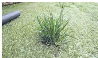
Справжня трава росте крізь штучну