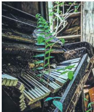
Фортепіано, залишене природі