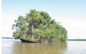
Затонуле судно перетворилося на острів