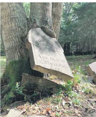
Природа знову перемагає