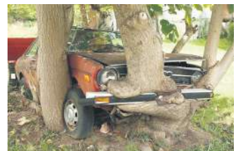
Коли зливаєшся з природою