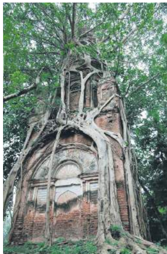
Старий храм Шиви міцно оповитий священним деревом Бодгі. Бангладеш