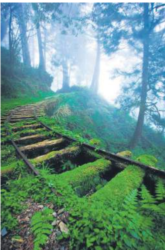
Залізничні колії в лісі. Тайвань