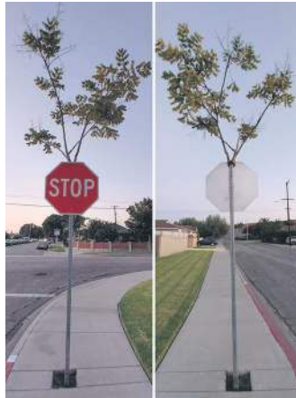
Це дерево виросло всередині знака "Стоп"