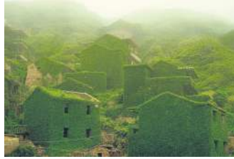
Це китайське рибальське село було покинуте в 1990-і роки. Природа все виправила. Хутуван, Китай

Ми, люди, часто будуємо дороги і мости, канали і порти, навіть цілі міста там, де колись панувала природа. Але вона не збирається здаватися. Навпаки, природа вже вкотре доводить, наскільки крихкі наші творіння, бо природа – це сила, на яку потрібно зважати.