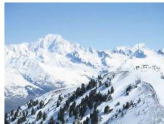
НАЦІОНАЛЬНИЙ ПАРК ЙОСЕМІТІ