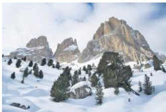
ПІВНІЧНА ЧАСТИНА БРИТАНСЬКОЇ КОЛУМБІЇ, КАНАДА