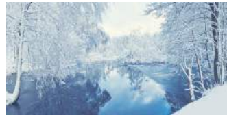
ОЗЕРО БЛЕД, СЛОВЕНІЯ