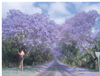
БАГРЯНИЙ ТУНЕЛЬ, ПІВДЕННА АФРИКА

Якщо ви любите бузковий колір – цей тунель для вас! У Йоганнесбурзі знаходиться створений руками людини ліс з понад 10 мільйонів дерев. Тропічні дерева, в тому числі 49 видів Джакаранда. У жовтні, коли вони цвітуть, земля покривається синіми і бузковими пелюстками.