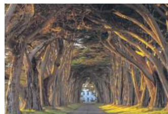
КИПАРИСОВИЙ ТУНЕЛЬ, США

У Коста-Ріці знаходиться фігурний парк Франциско Альварардо, названий іменем філіппінського письменника. Його творець – ландшафтний дизайнер Бренес – прославився тим, що створив тунель, використовуючи тільки садові ножиці.