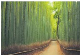
БАМБУКОВА СТЕЖКА, ЯПОНІЯ

Бамбуковий гай в районі міста Кіото в Японії – місце, повне умиротворення і таємничості. Через нього веде мальовнича доріжка довжиною 300 метрів, відгороджена парканом зі стebel дерев.