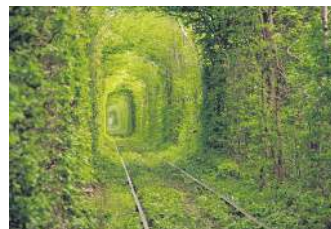
ТУНЕЛЬ КОХАННЯ, УКРАЇНА