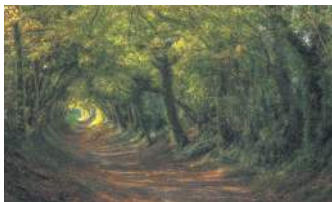
ДОРОГА В ХАЛНАКЕР, ВЕЛИКА БРИТАНІЯ

Загадковий тунель з Північної Ірландії ніби зійшов з обкладинки старої книги. Джеймс Стюарт посадив буки ще в 18-му столітті, щоб справляти враження на гостей на під'їзді до свого будинку Грейсхіл.