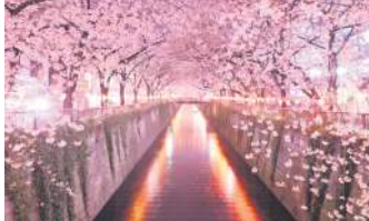
ТУНЕЛЬ З САКУРИ, ЯПОНІЯ

Тунель тисів в Уельсі надихав письменників з 1470 року. Середньовічний Будинок Абергласні, в саду якого знаходиться тунель, зараз є популярним туристичним місцем. Проте раніше через занедбаність тунель було практично знищено. На відновлення цього природного коридору пішло 9 років.