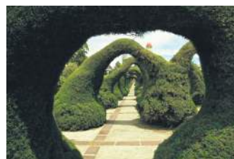
ПАРК «ФРАНЦИСКО АЛЬВАРАДО», КОСТА-РІКА

У англійському маєтку Боднантов розташовується арка Laburnum. Можливо, коли-небудь вона і була просто аркою. Тепер це справжній тунель, довжиною 55 метрів, суцільно вкритий квітучими «золотими» серижками.