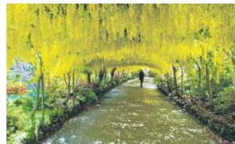
ТУНЕЛЬ З ВЕРБОЛОЗУ, ВЕЛИКА БРИТАНІЯ

Прогулюючись цим тунелем з гліцинії можна відчувати себе справжньою королівською особою. Квіти гліцинії, що звисають гронами, як виноград, починають цвісти, як тільки відцвітають вишні. Щовесни японці святкують фестиваль гліцинії в Токіо.