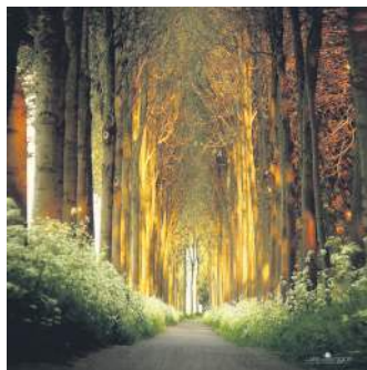
СТАРИЙ ГАЙ, НІДЕРЛАНДИ

Ці дерева, що ростуть у Вермонтському парку в «Ущелині контрабандистів», буквально палають всіма барвами осені. «Вистава» починається на більш північній ділянці і поступово переміщується на південь протягом сезону.