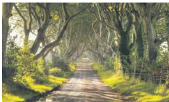
ТЕМНИЙ ГЛУХИЙ КУТ, ПІВНІЧНА ІРЛАНДІЯ

Природа прекрасна, але немає нічого чарівнішого, ніж опинитися під покривом дерев у формі живого тунелю. Сформувався він природним шляхом, або з невеликою допомогою талановитих садівників. Коридор з дерев зачарує кожного, кому пощастить пройтися поміж його зелених гілок.