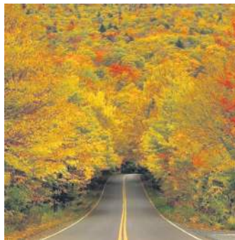
ТУНЕЛЬ ОСІННІХ ДЕРЕВ, США

Бамбуковий гай в районі міста Кіото в Японії – місце, повне умиротворення і таємничості. Через нього веде мальовнича доріжка довжиною 300 метрів, відгороджена парканом зі стebel дерев.