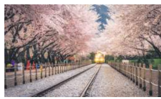
СТАНЦІЯ В ЧІНХЕ, ПІВДЕННА КОРЕЯ