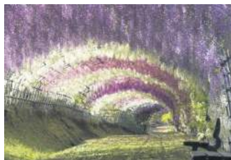
КВІТИ ГЛІЦІНІЇ, ЯПОНІЯ

Якщо ви любите бузковий колір – цей тунель для вас! У Йоганнесбурзі знаходиться створений руками людини ліс з понад 10 мільйонів дерев. Тропічні дерева, в тому числі 49 видів Джакаранда. У жовтні, коли вони цвітуть, земля покривається синіми і бузковими пелюстками.